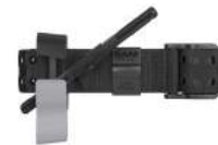
TACTICAL ZWART SAM XT-M