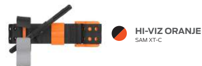
HI-VIZ ORANJE SAM XT-C