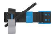
HI-VIZ BLAUW SAM XT-B